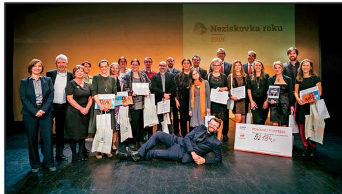
Fotografie ze slavnostního vyhlášení Neziskovka roku 2016, které se konalo 28. 11. 2016 v pražském divadle Archa.